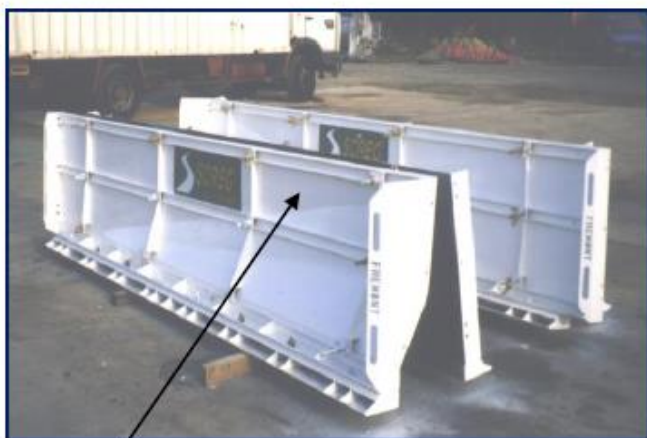
GBA en accotement Raccordement descendant

Raccordement hélice pour mise en place d'un capot reposant de 250 mm