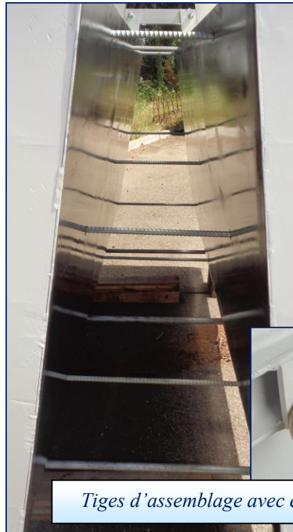
Tiges d'assemblage avec écrou 2 oreilles